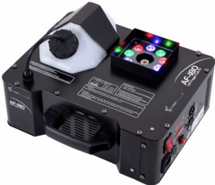
2 Stk. Stairville AF-180 LED Fogger