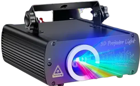
EHAHO L2600 Laser Projector