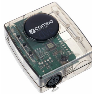
CAMEO DVC Interface