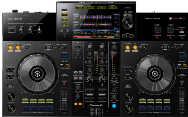
Pioneer DJ XDJ-RR