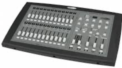
Showtec Showmaster 24 MKII