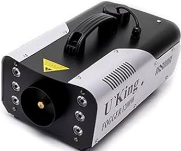
2 Stk. U´King 1200 W LED Fogger