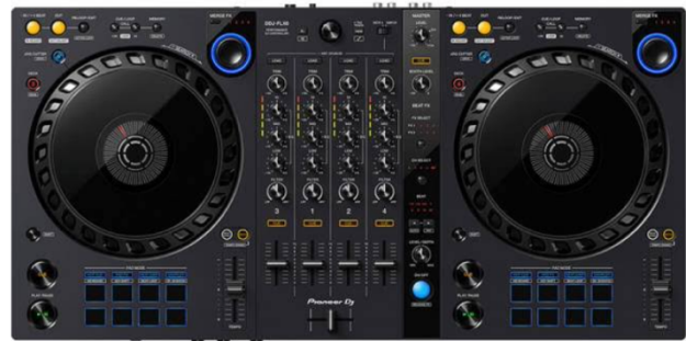
Pioneer DJ DDJ-FLX6