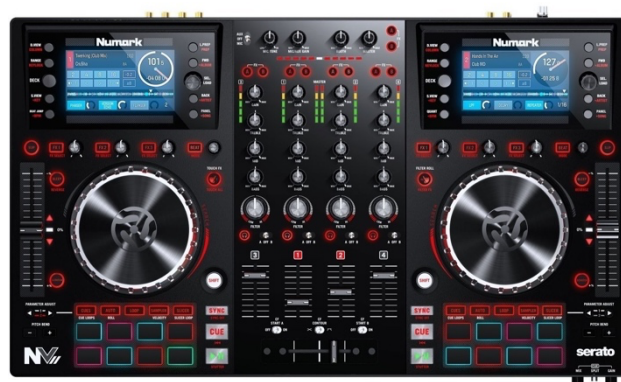
Numark NV II