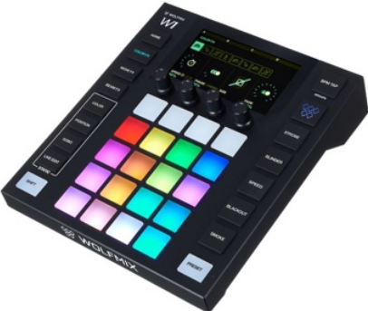
Wolfmix W1 MK2